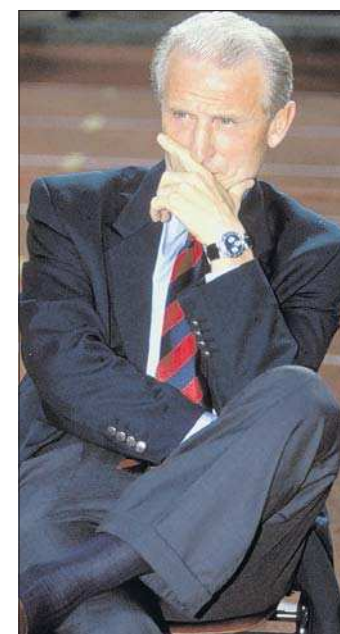
Rechenkünstler: Bayern-Trainer Giovanni Trapattoni hat sich verzählt.

Franz Beckenbauer, der damalige Präsident, verließ verärgert seinen Ehrenplatz. „Ich weiß doch nicht, wer da Amateur ist. In dieser Saison ist bei uns alles möglich“, gartelte der Kaiser. Recht hatte er. Mit einem mäßigen 5. Platz verabschiedete sich Maestro Trapattoni aus München.