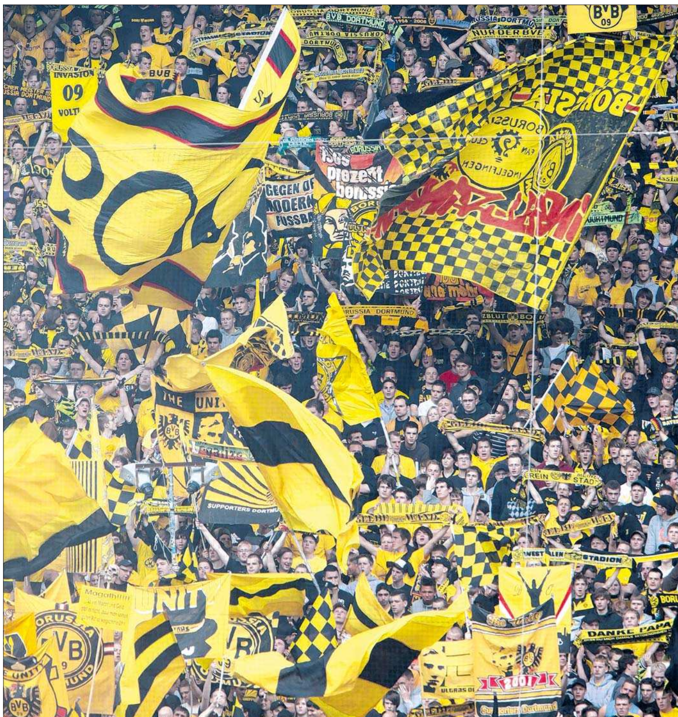
Eindrucksvoll und friedlich: Deutschlands größte Stehkurve – die „gelbe Wand“ in Dortmund.

Zunächst mal, dass es kein einheitliches Ultra-Bild gibt und schon gar nicht eine Organisation. Es sind Fans, die sich extrem engagieren: Sie fahren regelmäßig zu Auswärtsspielen, bereiten aufwendige Choreografien vor und fühlen sich verantwortlich für die Stim-